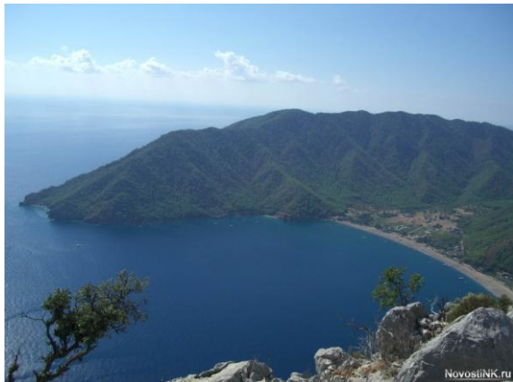
Гора Муса в наше время (современная Турция)

Երբ ստորաստեց և ներկայացրեց Մինաս Մովսեսյանը